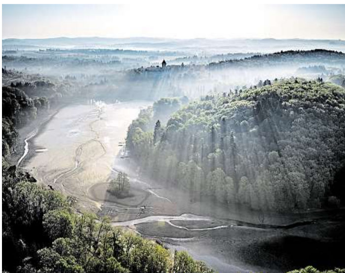
Svět pode mnou Fotograf Jirka Jiroušek létá na motorovém padáku a fotí krajinu. Toto je jeho pohled na zámek Konopiště.

S motorovým padákem startuje na loukách. „Lepší samozřejmě je, pokud jsou z kopce, ale mohou být i rovné. Při startu vás motor žene, takže potřebujete někdy jen pět, ale jindy i padesát metrů. Většinou vám 15 metrů stačí,“ líčí s tím, že kdyby se nerozbehl na tuto vzdálenost, raději zruší start. „To, abych nemusel běžet třeba sto metrů se záteží. S motorem, který už mám pod plynem, se totiž nezastavím na místě, ale musím dobíhat. Taky hrozí, že se třeba šňůry zamotají do vrtule. A navíc já létám v extrémním po-